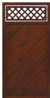
Przykładowe wzory „wstawki” ozdobnej